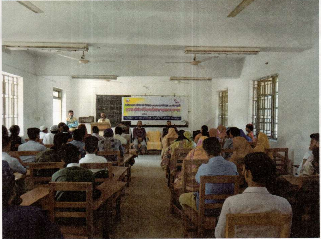
অসমত প্ৰতিষ্ঠিত- নিমিত্ত অহৰী জালত- অহৰী প্ৰথম প্ৰসঙ্গ সভা-ধাত-২৬