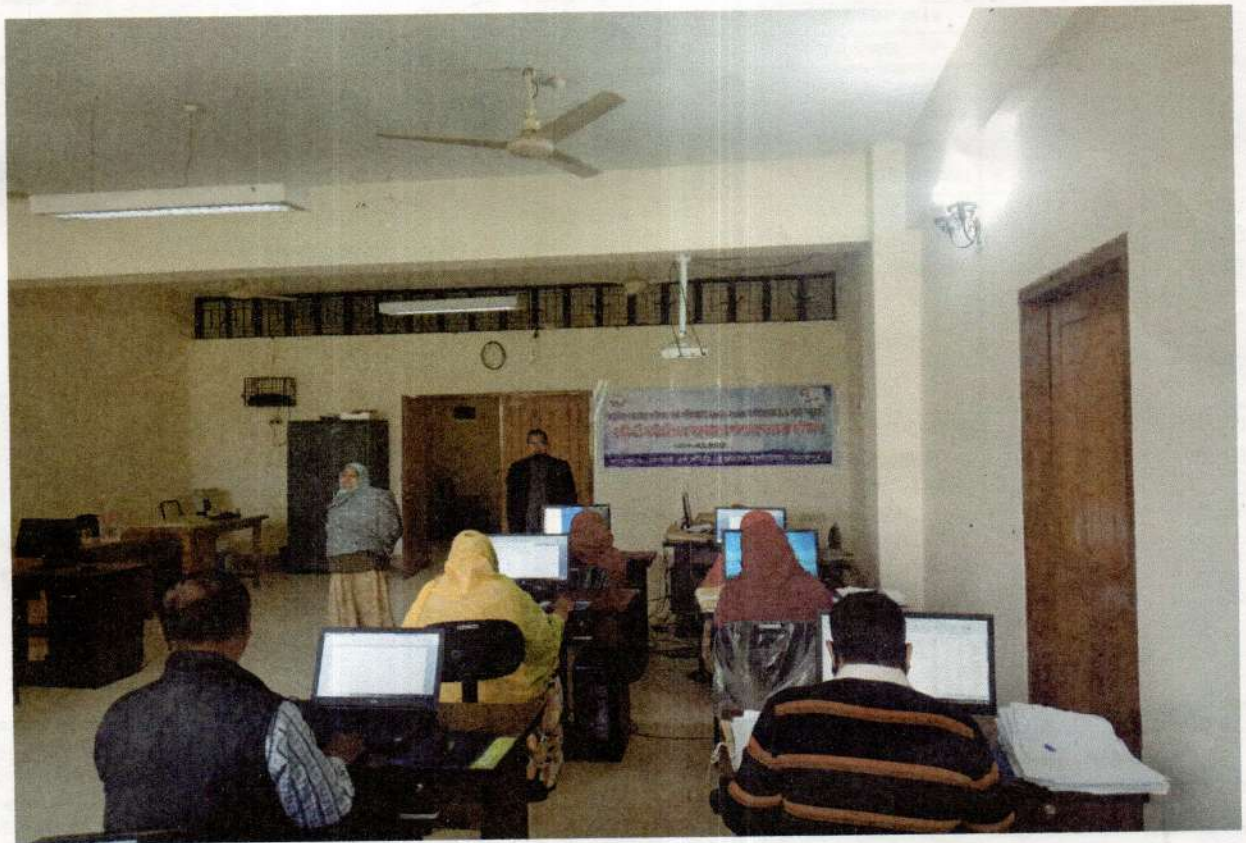
8.2 - (in 3 weeks) - (in 3 weeks) - (in 3 weeks)